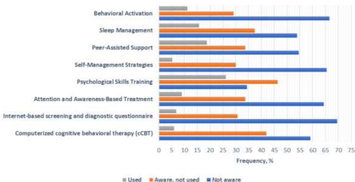
Figure 1. Participants' Knowledge and Utilization of Electronic Technologies in Psychological Interventions

In terms of training related to EMHIs, a majority of the participants did not receive such training. The number of participants