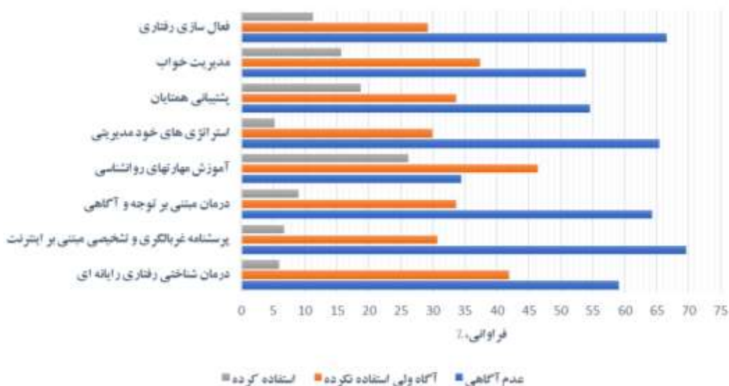
شکل ۱: دانش شرکت‌کنندگان و استفاده از فناوری‌های الکترونیکی در مداخلات روانی

بیشتر شرکت‌کنندگان در پژوهش، زن (۷۱ درصد) بودند و در محدوده سنی ۴۱ تا ۵۰ سال (۶۴ درصد) قرار داشتند. به طور کلی، میانگین سنی شرکت‌کنندگان 42/5 \pm 3/17 سال بود. بیشتر پاسخ‌دهندگان تحصیلات تکمیلی داشتند که در این میان، ۴۵ درصد دکتری و ۴۲ درصد کارشناس ارشد بودند. همچنین، بیشتر شرکت‌کنندگان (۴۷ درصد) مراقبین سلامت بودند (جدول یک). از گروه‌های سنی ۳۱-۴۰ و ۵۰-۴۱ سال به ترتیب، ۳۶ و ۱۸ درصد افراد از EMHI استفاده کرده بودند.